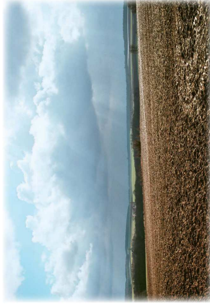
Collines de l'Orxois - Vue vers le sud, depuis la RD 17 après Coulombs (77)