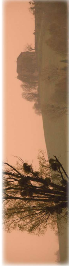
Butte de Doue (77)