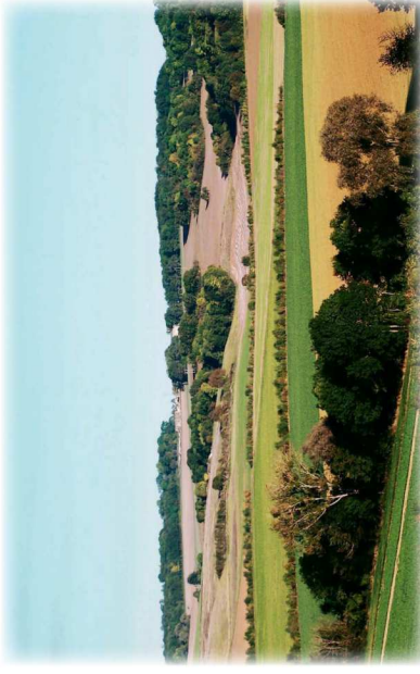
Collines de l'Orxois (77)