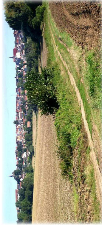
Butte de Dammarfin - Monts de la Goële (77)